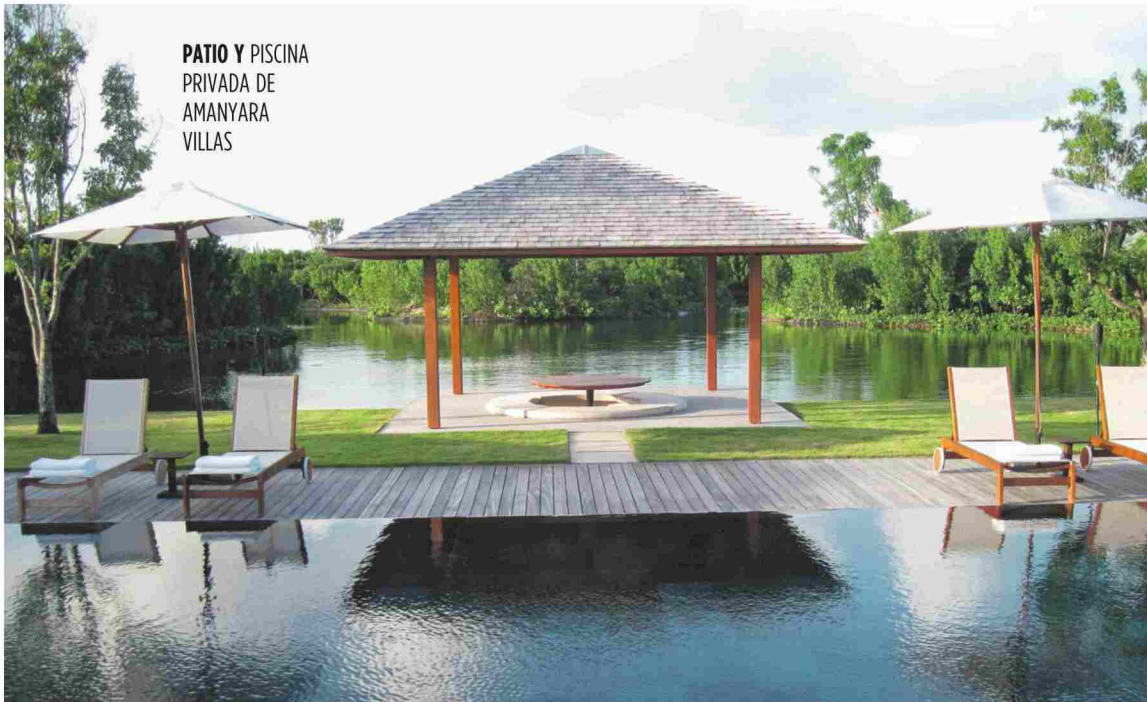
PATIO Y PISCINA PRIVADA DE AMANYARA VILLAS

LAS ISLAS TURCAS Y CAICOS, OFRECEN ADEMÁS DE LA BELLEZA DE UN LUGAR CASI VIRGEN, UNA GRAN OPORTUNIDAD PARA LOS AMANTES DEL DEPORTE COMO EL BUCEO, SNORKEL Y KAYAK